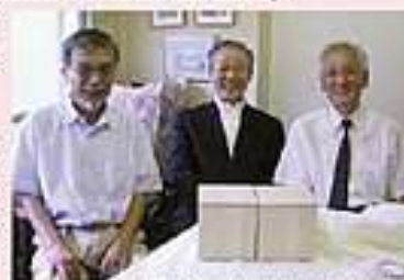
(向かって左がKさん、右が同社長、中央が私)

電話の先で「うーん」とのうなり声が入ってきました。しかし、すぐに「あっ紹介できますよ。私たちの会員で、定年後に趣味で木工の工房をもたれている方がいます」