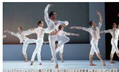
【ル・スフォルド・ワレズブリ〜魂のため息〜】彩の国さいたま芸術劇場公演より

世界のバレエシーンを牽引する実力派ダンサーが集う華やかな公演。最も旬なバレエ振付家のひとりとして世界中から注目を集めている、ドレスデン・バレエプリンシパルのイリ・ブベニエクの作品のみで構成した本公演に出演するのは、ドラマティックバレエの殿堂ハンブルグ・バレエのプリンシパルオットー・