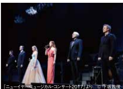
「ニューイヤー・ミュージカル・コンサート2017」より © 下坂敦俊