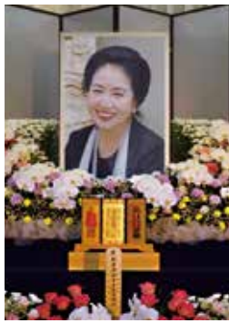
安西先生祭壇(2017年7月13日)

卒業し、初代「NHK歌のおばさん」を寝たきりの長男の介護をしながら務め、政界にも清らかな一陣の風を吹かせました。政界勇退後も、音楽活動や講演活動を精力的こなし、1995年には日比谷公会堂で80歳の記念リサイタルを行いました。衰えを知らない美しい声で二千人ものファンを魅了しました。好きな言葉は「心に太陽を唇に歌を」、「困った人を見ると、放っておけないのヨ」英語では「May I help you?」