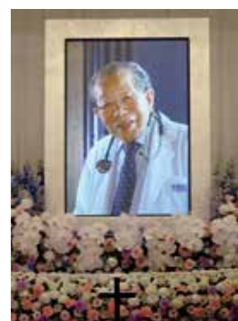
日野原先生祭壇(2017年7月29日)

なり、よい病人になり、よい死に方をする事。そのためには、感謝に満ちた「Keep on going 前進また前進