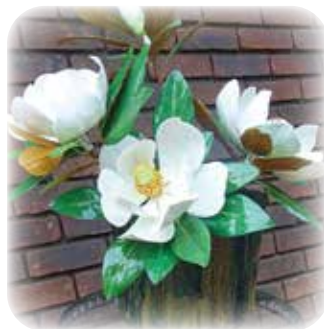
タイサンボク(泰山木)

ホテルでの「お別れの会」の式典の流れは、献花に始まり、ウエルカムドリンク、献奏、黙祷、