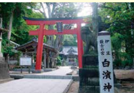
白濱神社(ホテル伊豆急より徒歩8分)

【問い合わせ】 03(3463)8201 http://www.hotel-hizukyu.co.jp/