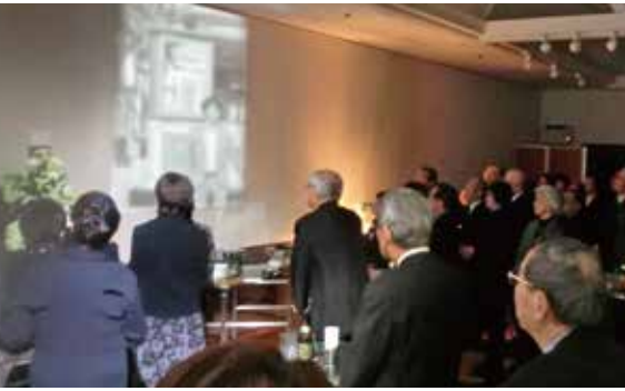
プロジェクターで思い出のシーンを放映

お別れの言葉(思い出スピーチ)、喪主の挨拶、そして、食事の時をもち、散会となります。家族葬当日の午後あるいは夕刻から始める一日葬、一週間後あるいは四十九日前後に行うなど日程的には自由度が高い方法です。従来は社葬や大型葬儀が多かったホテルでの「お別れの会」が、最近では個