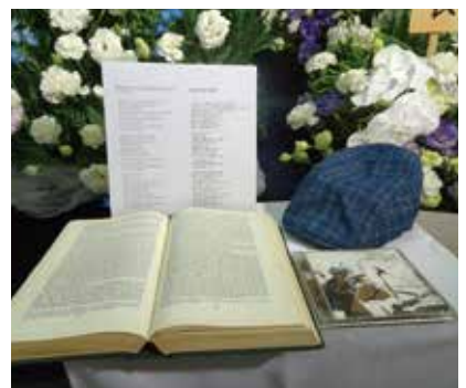
愛用のバイブルと愛聴CD

ホテルでの「お別れの会」のメリットは①交通の便が良い②バリアフリー③料理の内容が選べる④駐車場が完備⑤宿泊が可能⑥音響・映像・照明などの設備が充実などです。一方デメリットは①斎場と比べると費用が少し高い②接客技術のプロだが、葬儀専門で