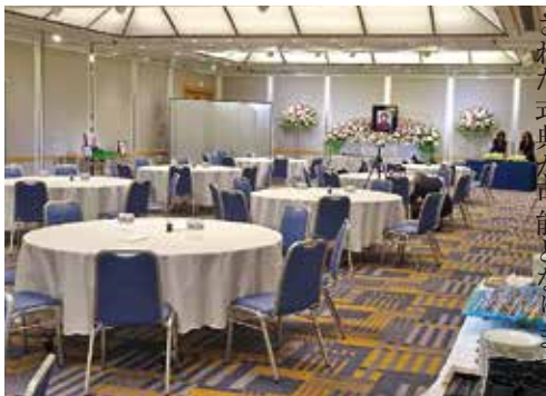
明るく開放的なホテルの式場

ホテルでの「お別れの会」のメリットは①交通の便が良い②バリアフリー③料理の内容が選べる④駐車場が完備⑤宿泊が可能⑥音響・映像・照明などの設備が充実などです。一方デメリットは①斎場と比べると費用が少し高い②接客技術のプロだが、葬儀専門で