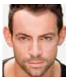
ベン・フォスター

今年、「オペラ座の怪人」ウエストエンド30周年公演の主演を務めたベン・フォスター、