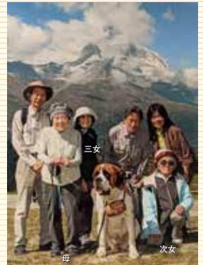
スイス側からマッターホルンを背景に