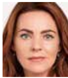
レイチェル・タッカー