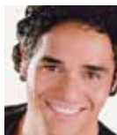
アダム・ジェイコブス