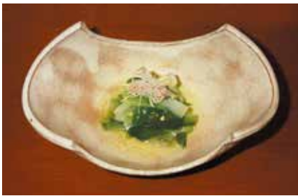
【春野菜の山葵酢浸し】

東急百貨店 本店 8F TEL.03(3477)3655 http://www.nadaman.co.jp