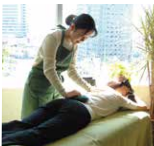
人気のコースはフルボディデラックス(60分)7,000円

お店「ヒーリングガーデン」が幅広い年代の方から人気を集めています。耳から聞こえる音楽と同じ音の響きが体感振動として