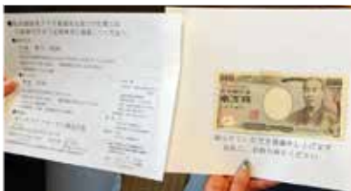
緊急時のお願いとお礼

おひとり暮らしの男性が、ご自宅で亡くなられました。数日の間、玄関のドアが開かなくなったので、お隣の方が心配して、警察に連絡し、死亡が確認されました。枕元には、2枚の書類（下写真）が置かれていました。A4サイズ台紙に1万円札