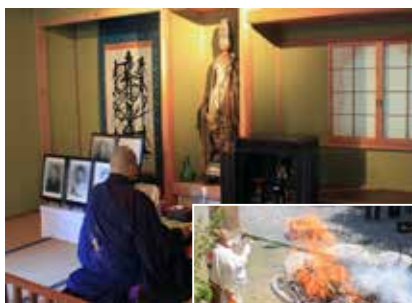
寺院での魂抜き法要と、蓮華壇でのお焚き上げ

近年、首都圏でのお焚き上げは困難ですが、この時は秩父の寺院で消防署立会いの下、安全に施行できました。