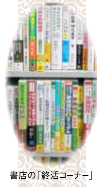
書店の「終活コーナー」

「今は高齢者施設で楽しく過ごしていますが、86才になり後のことが心配です。特にご先祖さまの位牌が6柱、遺影