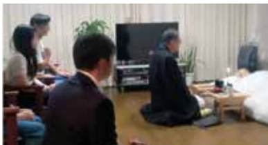
家族団欒でのお別れ

した。首都圏の慌ただしい葬儀事情からは考えにくいのですが、故人の意思に基づいた心温まるお別れができました。